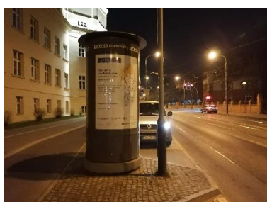
Citylight - ul. Grunwaldzka/Śniadeckich

Przedstawiamy fotografie wybranych realizacji.