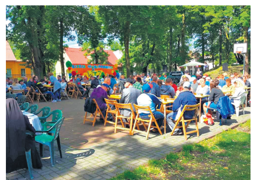
Piknik Integracyjny 2017, WTZ i Spółdzielnia Talent

Artykuł sponsorowany w ramach projektu Wielkopolskie Centrum Ekonomii Solidarnej