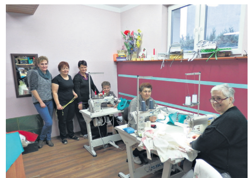
CIS Ostoja - warsztat krawiecki