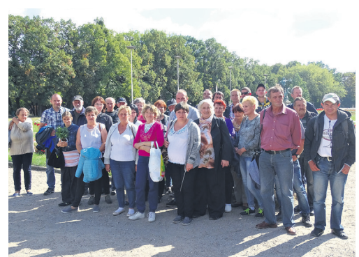
CIS Ostoja - integracja w poznańskiej palmiarni

Projekt Wielkopolskie Centrum Ekonomii Solidarnej (Ośrodek Wsparcia Ekonomii Społecznej), realizowany jest przez partnerów: Fundację Pomocy Wzajemnej Barka, Wielkopolską Radę Koordynacyjną Związków Organizacji Pozarządowych oraz Związek Organizacji Sieć Współpracy Barka.